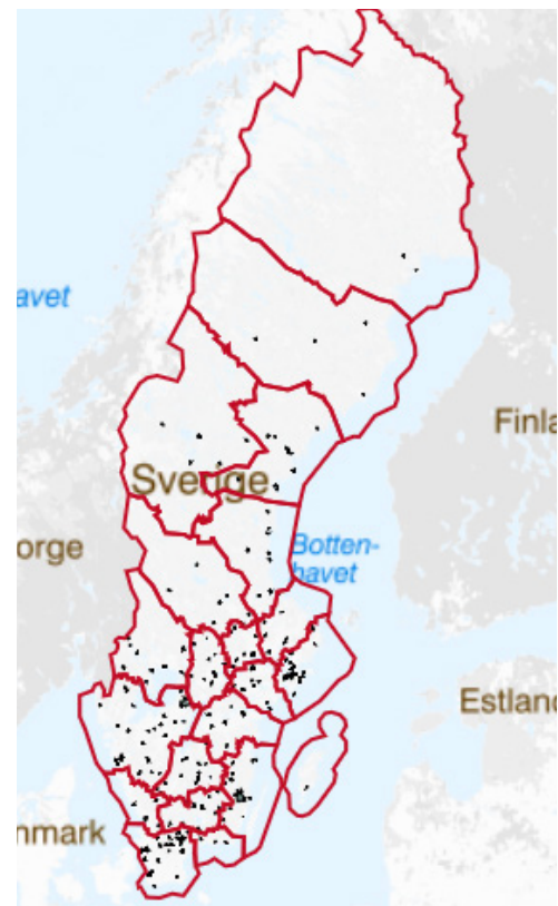
För att utforska ojämlikhetsindex och områdestyper över hela Sverige, gå till interaktiv karta på boverket.se