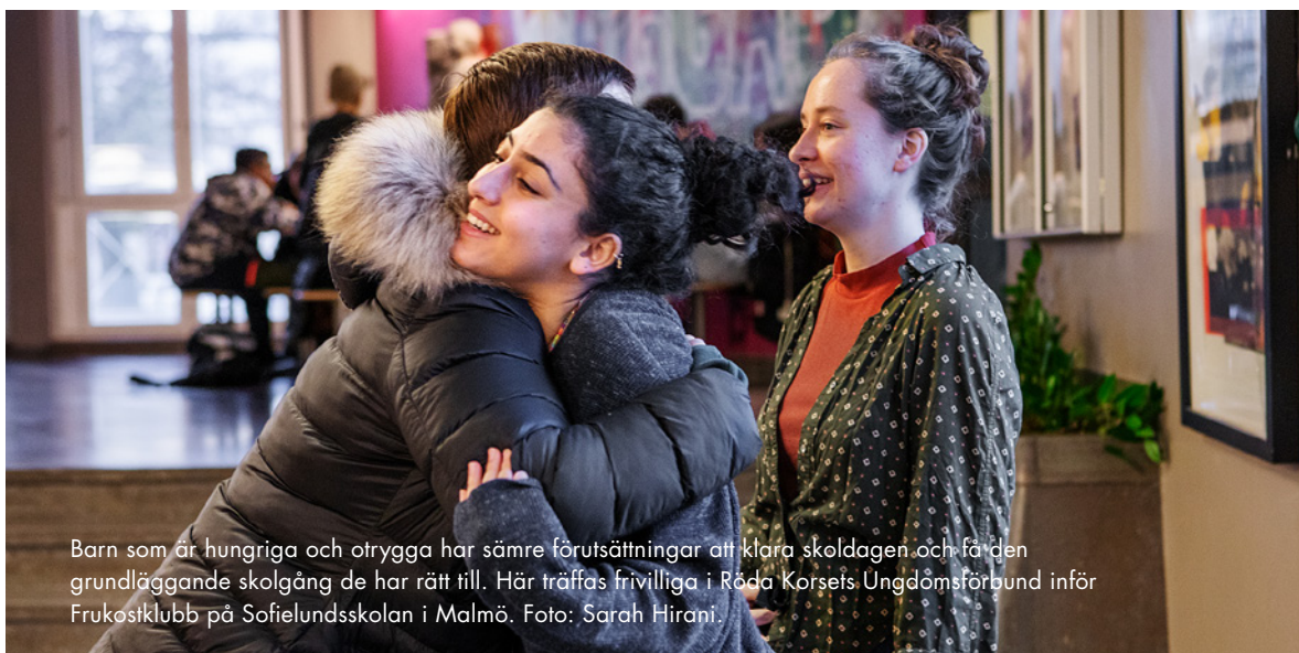
Barn som är hungriga och otrygga har sämre förutsättningar att klara skoldagen och få den grundläggande skolgång de har rätt till. Här träffas frivilliga i Röda Korsets Ungdomsförbund inför Frukostklubb på Sofielundsskolan i Malmö.

KOMMUNEN KOMMER DOCK aldrig ensam att kunna nå ut till alla i behov av stöd efter en all- varlig händelse såsom en skjutning. Samverkan med lokala aktörer verkar vara speciellt viktigt vid identifiering av och förståelse för kriser, vilket diskuteras djupare i kommande kapitel. Ett konkret exempel som lyfts i flera intervjuer är kunskap om vilka etablerade mötesplatser som finns i området. Ett annat är att snabbt kunna identifiera i vilka områden som krisstödsinsatsen behöver sättas in, exempelvis om en skjutning sker centralt men offer eller gärningsman är hemmahörande i en annan del av samhället. Den här samverkan och kunskapen om lokala nyckelaktörer behöver till stor del byg- gas upp innan en kris sker.