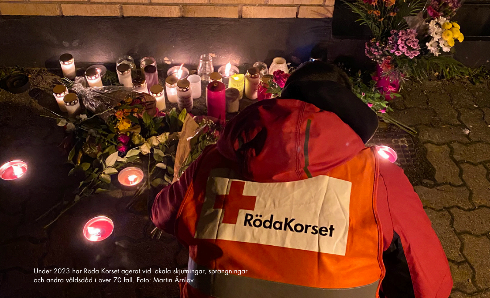
Under 2023 har Röda Korset agerat vid lokala skjutningar, sprängningar och andra våldsdåd i över 70 fall.

Det finns idag nästan ingen forskning som i en svensk kontext tittar på hur den förhöjda våldsnivån påverkar individer och bostadsområden. Den här rapporten är därför en viktig pusselbit när det gäller att förbättra arbetet med att stödja