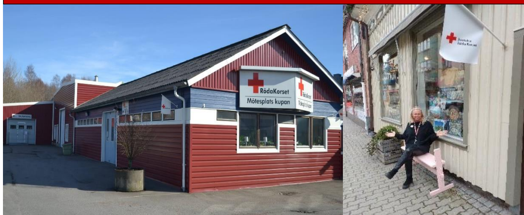
Vår stora Second Hand butik på Verkstadsgatan 4

Kungsbacka bygdens Röda Korskrets har 2 välbesökta Second hand butiker i Kungsbacka